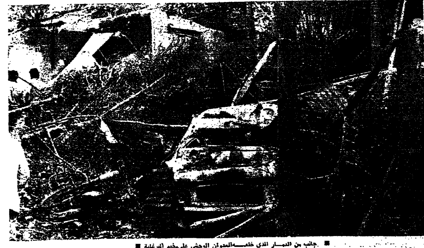
جانب من الممار الذي خلفه العدوان الوحشي على مخيم البرغلة